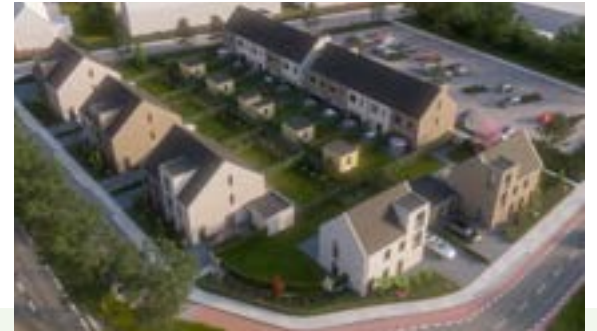
Impressie Planetenlaan / Piet Heinlaan

Het gaat om de bouw van 18 koopwoningen bestaande uit: • 6 tweekappers; prijssegment € 425.000 - € 455.000; • 10 rijwoningen; 4 hoekwoningen prijssegment € 260.000 - € 290.000 en 6 tussenwoningen van € 200.000; • 2 vrijstaande woningen; prijssegment vanaf € 550.000.