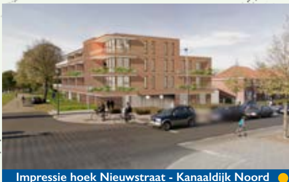
Impressie hoek Nieuwstraat - Kanaaldijk Noord