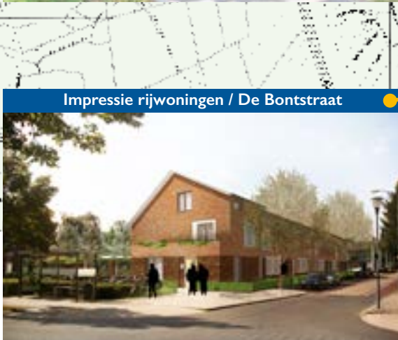
Impressie rijwoningen / De Bontstraat